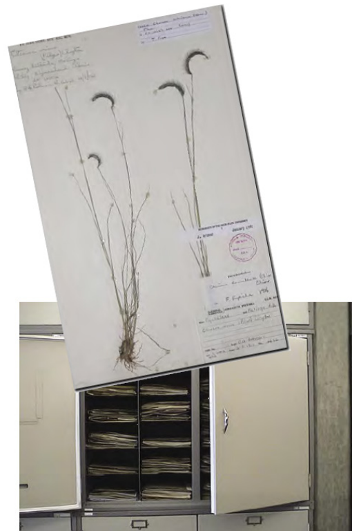
شکل ۵- قفسه‌های هرباریوم (۹)