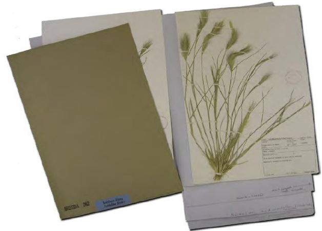
شکل ۴- پوشه حاوی نمونه (۹)