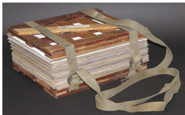
شکل ۱- دستگاه پرس جهت خشک کردن نمونه‌های گیاهی (۹).

نمونه‌ها را باید در کوتاه‌ترین زمان ممکن پس از جمع‌آوری پرس کرد. وسیله پرس شامل دو تخته چوبی چند لایه با ابعاد (۳۰×۴۵) سانتی‌متر که بین آن‌ها صفحات شیاردار و روزنامه قرار می‌گیرد. گیاهان را بعد از خارج کردن از کیسه باید تمیز کرده، روزنامه دور نمونه گیاهی پیچیده و بر روی آن شماره نمونه نوشته شود. صفحات شیاردار به هوادهی و خشک کردن نمونه‌ها کمک می‌کند. پرس به این ترتیب قرار داده می‌شود: تخته پرس، هواکش، خشک‌کن، روزنامه (با نمونه گیاهی)، خشک‌کن، هواکش و به همین ترتیب ادامه می‌یابد؛ تا در آخر با قرار دادن یک تخته پرس دیگر بسته می‌شود. پرس بوسیله دو تسمه یا نوار محکم بسته می‌گردد. فشار اعمال شده نباید آنقدر کم باشد که اندام‌های گیاه در نتیجه به وجود آمدن فضاهای آزاد، جمع و چروکیده شود و نه آنقدر زیاد باشد که موجب متلاشی شدن گیاه و مانع مبادلات هوا گردد [۶].